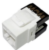
Modulo Cat 6 Keystone.

ANSI/TIA/EIA-568.2-D e ISO/IEC 11801, EN50173-1, y considerando como base de cumplimiento la medición del peor caso de todas las combinaciones de pares. Deberán permitir conexión T568-A y T568-B. Estos módulos deberán soportar conductores sólidos UTP de 22-24 AWG, cuatro pares. Los conectores deben poseer contactos terminales provistos de un recubrimiento de 50 micro pulgadas de oro, (la cual será justificada con carta del fabricante), con lo cual se asegura que no existan problemas de sulfatación. El circuito impreso deberá estar totalmente encapsulado. La terminación en los módulos se debe realizar en la parte posterior permitiendo el ingreso lateral y posterior del cable, implementando ponchadora tipo 110 de impacto, además debe permitir el aseguramiento de la retención y fijación del cable.