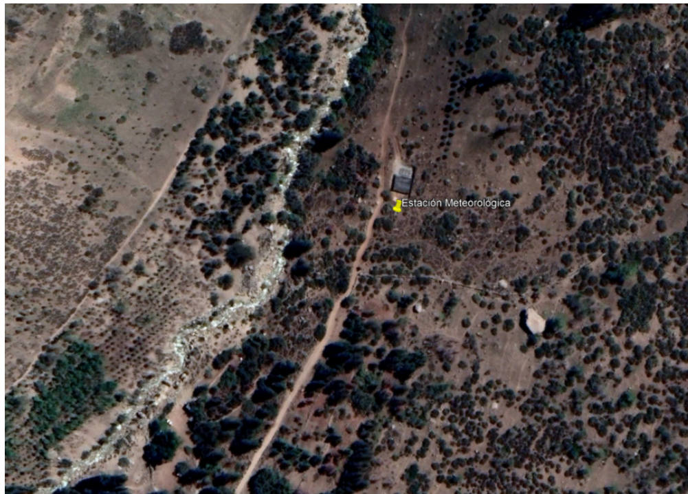
Imagen referencial: Ubicación Estación Meteorológica en Yerba Loca.

Parque Cerro del Medio: Ubicado en la cumbre del predio municipal Parque Cerro del Medio. Coordenadas referenciales para la instalación: -33.340546° y -70.539221°