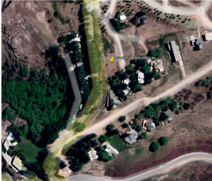
Imagen referencial: Ubicación Estación Meteorológica en Farellones.

Farellones: Ubicado en Área Verde Pública. Gran Bajada la cual contempla acceso vehicular. Coordenadas referenciales de instalación: -33.35.3856 y -70.316393.