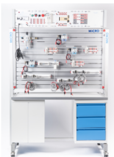
Imagen referencial del producto