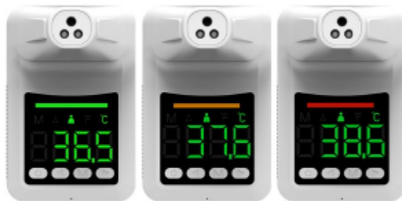
Fig. 1 Imagen referencial de Termómetro Digital.