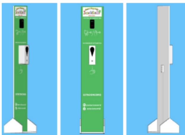
Fig. 3 Imagen referencial de estructura del Dispensador Digital.