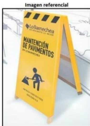
Ejemplo de letrero o paloma informativa Municipal.

Cabe mencionar que será de cargo del contratista la provisión de letreros y señalética necesaria para la ejecución de los trabajos. Para ambos casos, el contratista deberá preocuparse que estos letreros permanezcan en óptimas condiciones de presentación y legibilidad y deberán instalarse al momento de iniciar las obras. La Municipalidad podrá suministrar señalética extra que deberá ser utilizada conforme lo establezca el ITM.