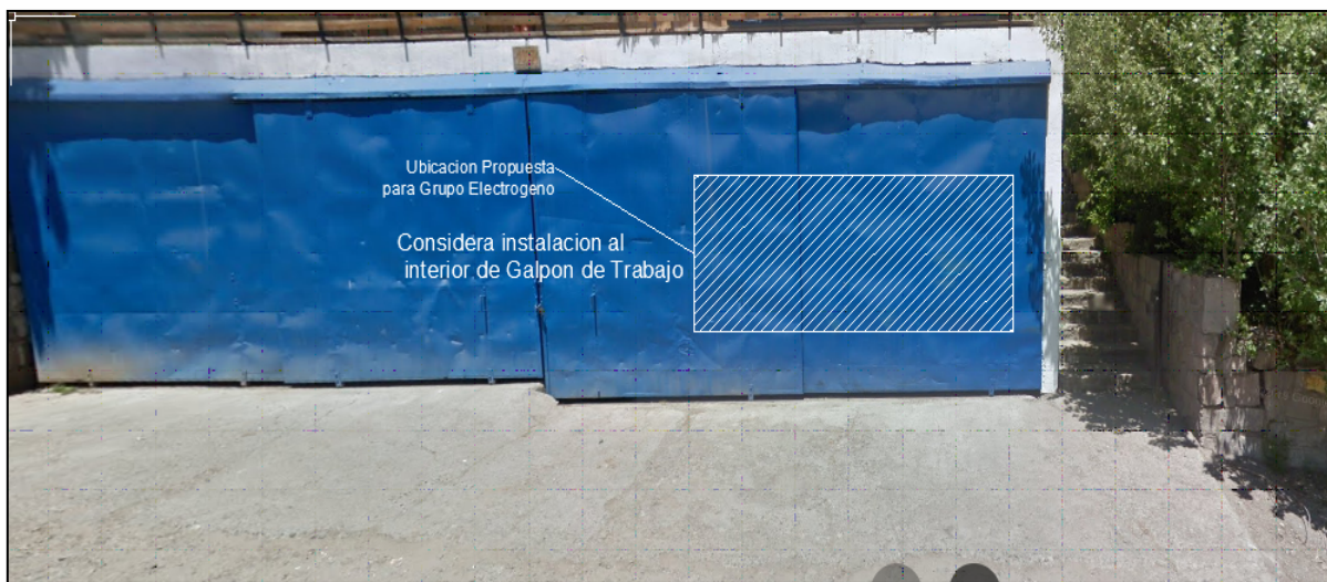
Figura 3.1.- Ubicación Grupo electrógeno Centro de Montaña, vista frontal.