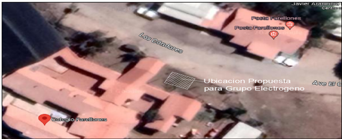
Figura 2.- Ubicación Grupo electrógeno Colegio Farellones.