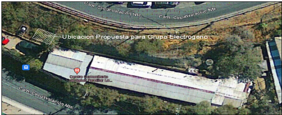
Figura 1.- Ubicación Grupo electrógeno CECOSF Cerro 18